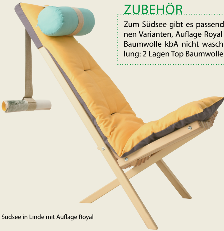
Südsee in Linde mit Auflage Royal

Zum Südsee gibt es passende Auflagen in 2 verschiedenen Varianten, Auflage Royal und Auflage DeLuxe. Bezug Baumwolle kbA nicht waschbar, Farbe frei wählbar. Füllung: 2 Lagen Top Baumwolle kbA 1200 g/m 2