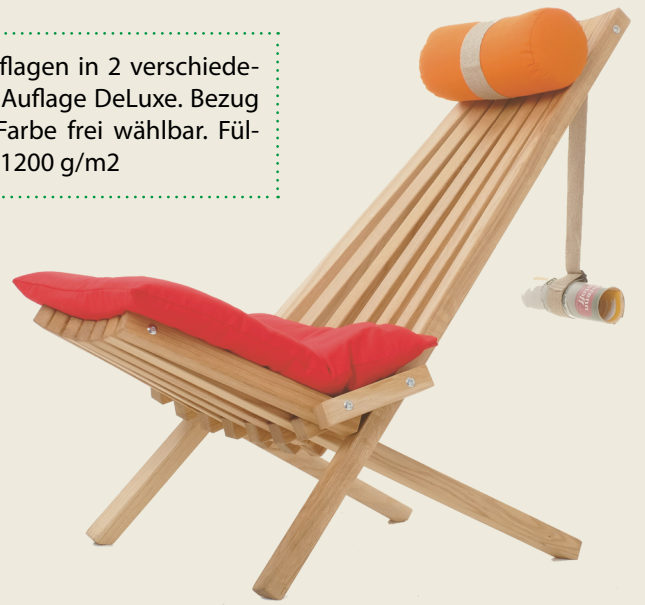
Südsee in Eiche mit Auflage DeLuxe