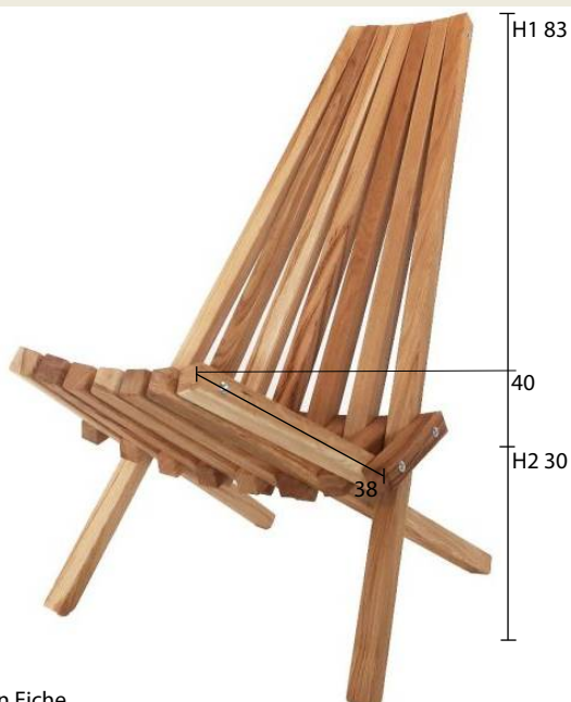
Südsee in Eiche

Massiver Klappstuhl aus Linde oder Eiche, hartgeölt und gewachst, platzsparend zu verstauen. Holzlinen zwischen Holzstäben an der vorderen Kante der Sitzfläche. Gesamthöhe H1 = 83 cm, Sitzhöhe H2 = 30 cm (steigt nach vorne auf 40 cm an), Sitztiefe = 38 cm