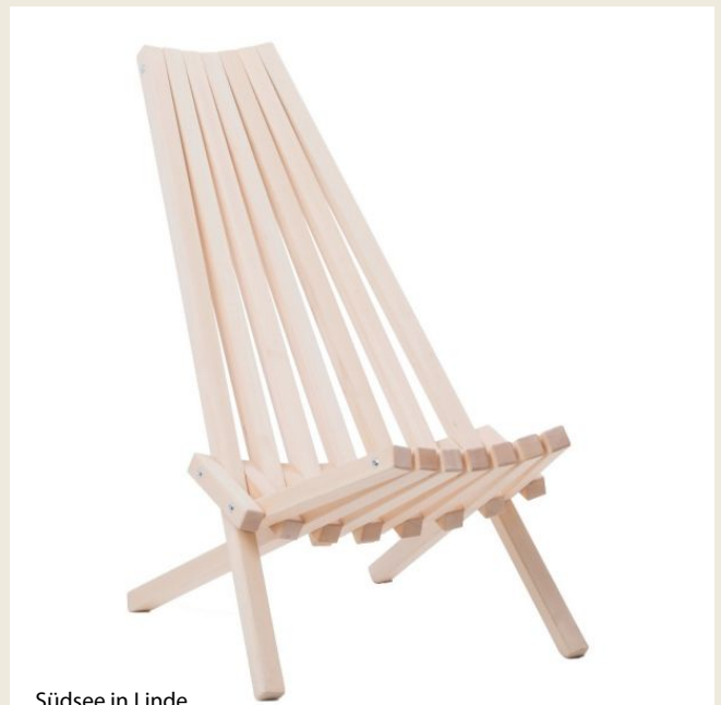
Südsee in Linde